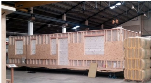
Muro exterior de 30 cm de grosor con SATE (Sistema de Aislamiento Térmico Exterior)

Esta vivienda cumple el Código Técnico de la Edificación, sobrepasando sus exigencias en cuanto a aislamiento térmico y acústico. Se construye en base a los requerimientos del Passivhaus Institut de Darmstat. Igualmente, sobrepasa lo exigido para la clasificación energética A .